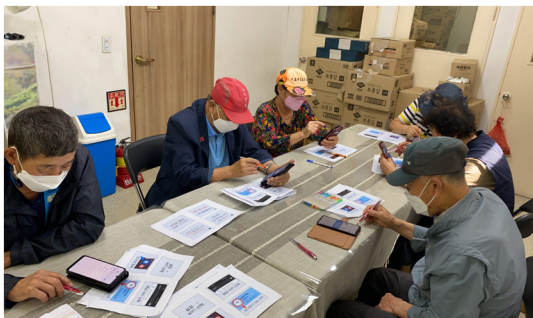
▶ 어르신 핸드폰 모임