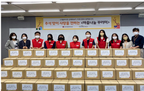
▶ LG헬로비전 후원행사