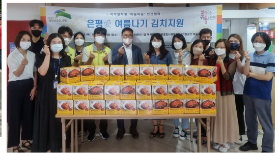
▶ 응암2동 민관협력 여름애(愛) 여름나기 김치지원 사업