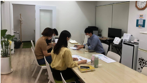
▶ 9월 응암2동 민관협력 회의