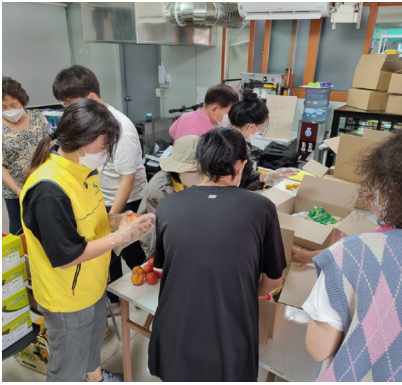
▶ 9월 주민모임지원사업 이웃돌봄 나누미 과일꾸러미 포장 및 전달