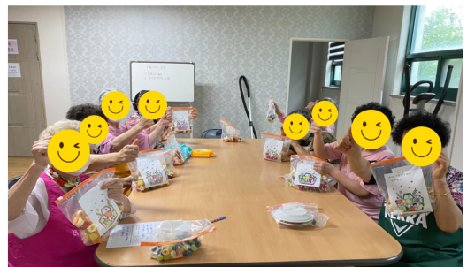
▶ 지역사회 어르신 체험활동