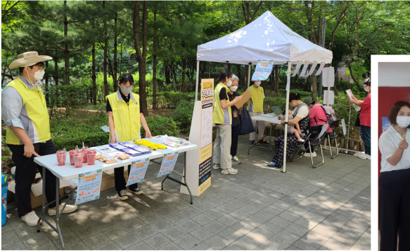
▶ 7월 응암2동 찾아가는 주민데이