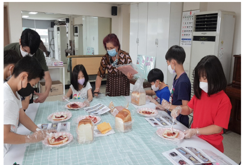
▶ 여름방학누림활동 II