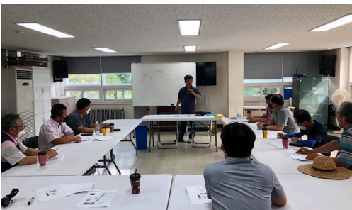
▶ 중장년남성1인가구 지원사업 '행복함끼' 셀프집수리교육