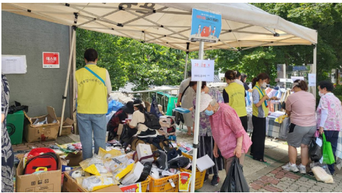
▶ 수색동 미니바자회