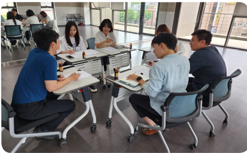
▶ 5월 은평형 동단위네트워크 3권역 회의 개최