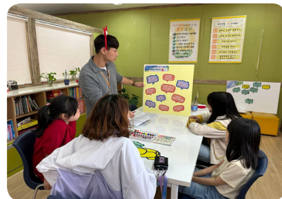
▶ 5월 5월 응암3동 취약계층 지원사업 (어린이날 행사)

*표지사진_뚝뚝뚝 푸른모임 그림일기 전시회 참여는 p6에서 보실 수 있습니다.