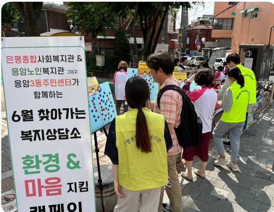
▶ 6월 응암3동 찾아가는 복지상담소