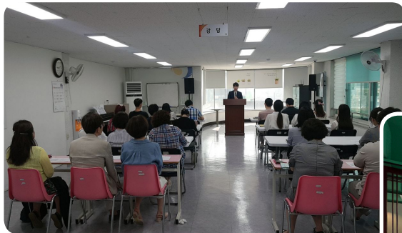
▶ 6월 새힘날교육