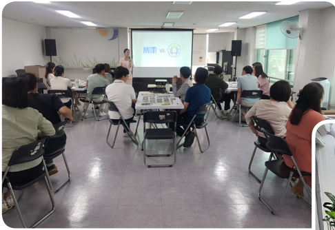
▶ 5월 직원교육 '에니어그램교육'