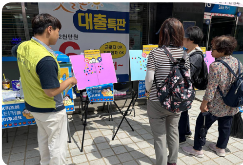
▶ 5월 응암3동 찾아가는 복지상담소