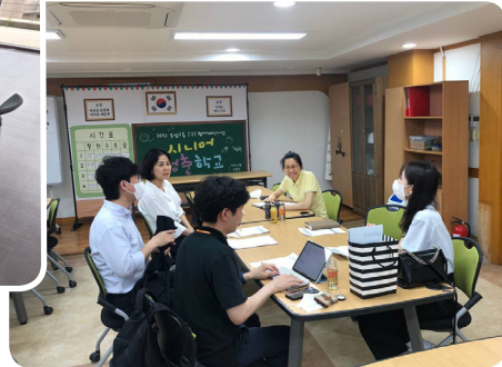
▶ 5월 응암2동 민관협력 회의