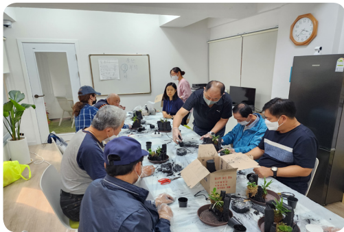
▶ 6월 행복함끼 프로그램 플라워테라피 활동