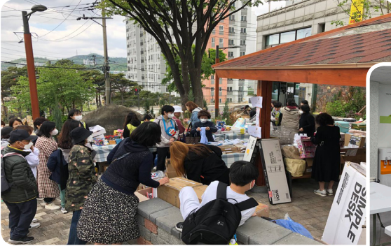
▶ 4월 응암2동 매바위미니바자회 개최