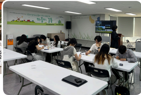
▶ 5월 마을이 꿈틀 교육