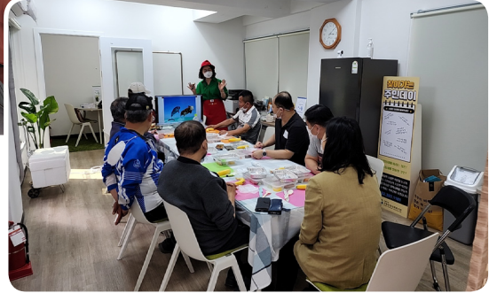
▶ 5월 행복함끼 프로그램 푸드테라피 활동